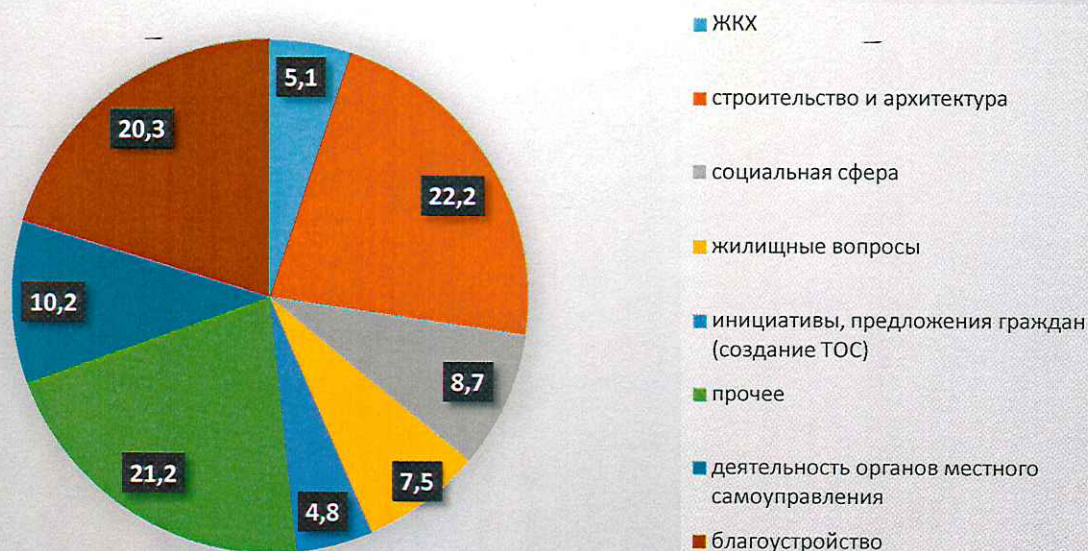
Диаграмма основных тем обращений граждан в 2020 году по разделам (общее количество обращений 334)

По результатам рассмотрения обращений в 90,7 % случаев оказана помощь либо даны разъяснения и консультации, 5,4 % обращений